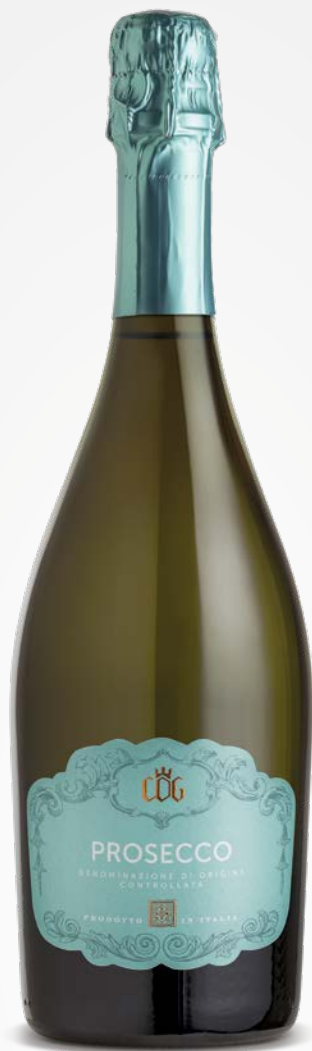
CDG Cantina del Garda PROSECCO SPUMANTE DOC EXTRA-DRY 0.75 ML