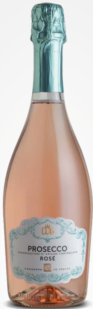
CDG Cantina del Garda PROSECCO DOC ROSÉ SPUMANTE EXTRA DRY 0.75 LT