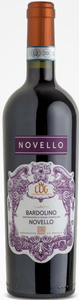
CDG Cantina del Garda BARDOLINO DOC NOVELLO